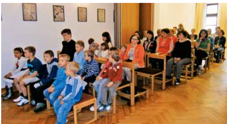
Zahvalna maša ob koncu šole in materinskem dnevu

Procesija SRT v Münchnu. V mestnem jedru velike bavarske prestolnice je na praznik sv. Rešnjega telesa in krvi spet potekala veličastna slovesnost v čast temu zakramentu. Tu je dela prost dan in verniki se res lahko zberejo v velikem