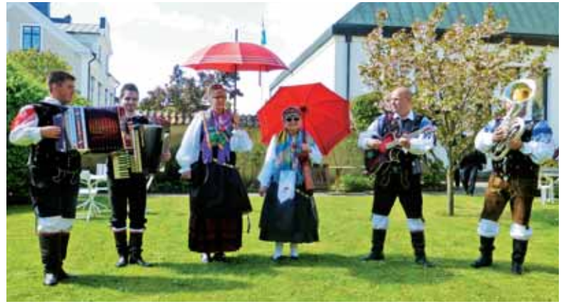
Ansambel iz Slovenije