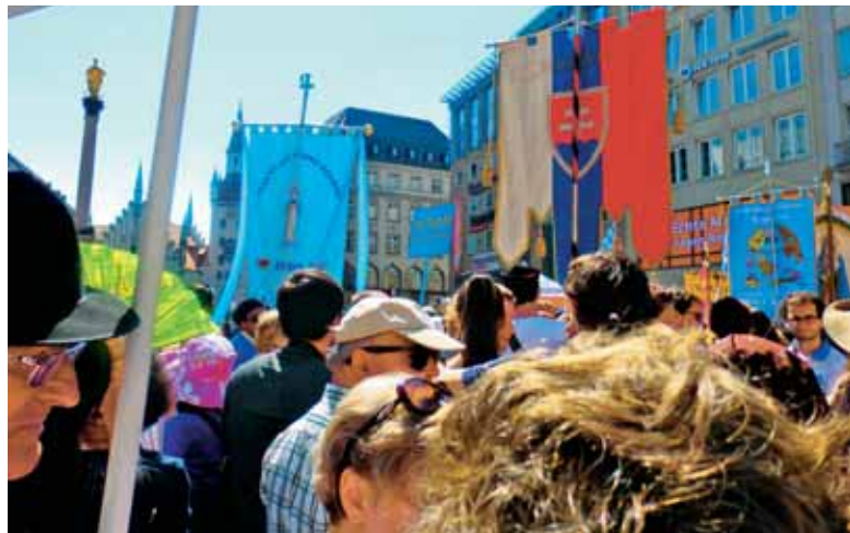
... med njimi veliko katoličanov iz narodnih župnij

številu k dogodku, ki ga vsako leto pričakuje veliko vernih domačinov in priseljencev. Letos je bilo 4000 udeležencev. Sveto mašo in procesijo je vodil kardinal Marx. V pridigi je izpostavil sestanek G7 v gradu Elmau pod Alpami blizu Garmisch-Partenkirchna. Politika in mediji govorijo o usodnem pomenu te konference za svet, vendar je vse to veliko prizadevanje le človeško delo, ki ne more rešiti sveta vseh zadreg, stisk in krivic in prinesiti polnega sadu pravičnosti in miru. To je treba iskati zunaj naprezanj ljudi, pa naj bodo