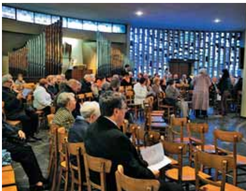
V okrogli obliki cerkve smo lahko še lepše zbrani ob Njej.