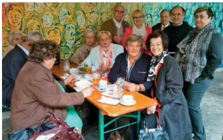
Veselo praznovanje po sv. maši v križnem hodniku