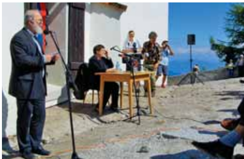
Že vrsto let moderator na romanju treh Slovenij na Sv. Višarje