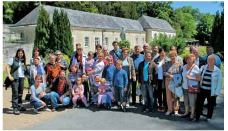
Skupinska slika romarjev v parku pred baziliko Marijinih prikazovanj

V sredo, 22. maja, smo na pokopališču v Chatillonu pokopali dolgoletno