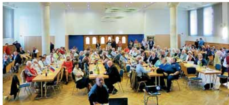
Binkoštno srečanje 2015 v Essnu – dvorana je kar lepo zasedena

Po sveti maši, ki naj bi bila kar najlepše pripravljena in izvedena, sledi praznovanje v dvorani. Najprej je potrebno pravočasno stopiti v stik z