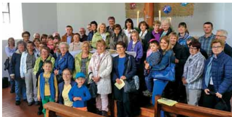
Letošnji slovenski romarji k Mariji v Ahorn