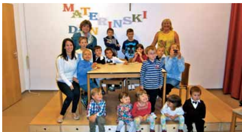
Zadovoljni otroci in učitelji