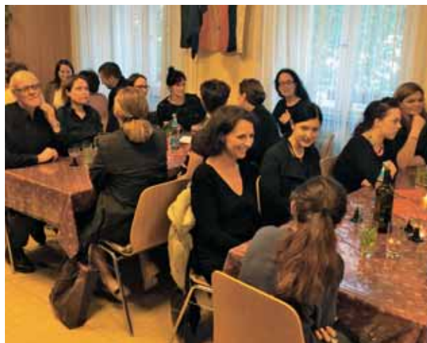
Zbor mednarodne šole Berlin