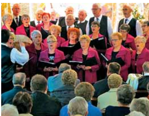
Z izbranim petjem ga je pozdravil mešani pevski zbor Jadran iz Merlebacha.