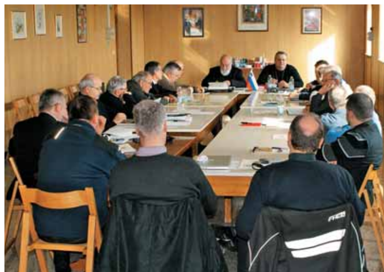
... in konferenca slovenskih izseljenkih duhovnikov