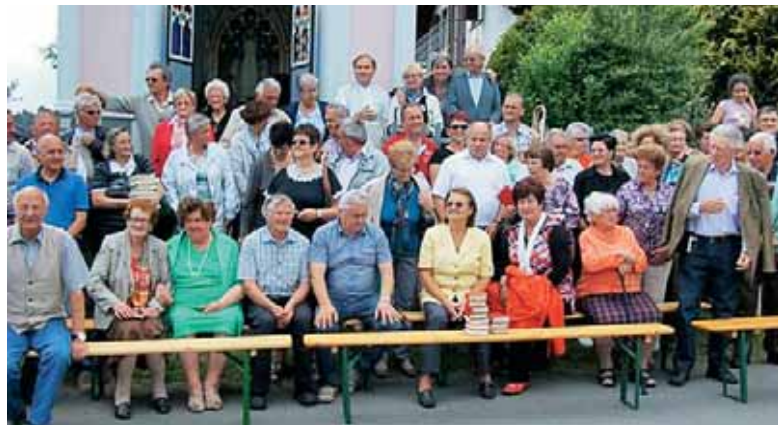
Šmarnice pri Ediju in Nadi v Schweinzu