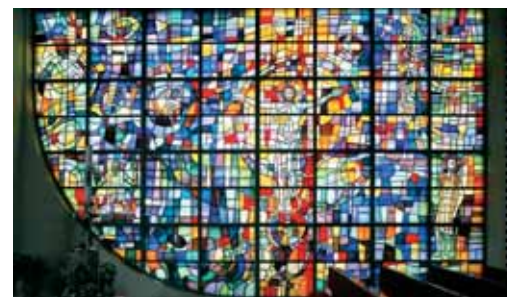
Stane Kregar, Vstali Kristus, Koseze v Ljubljani

V Sloveniji ni bilo o srednjeveški zgodovini vitrajev napisano nobeno pomembnejše delo. Najbrž pa bi barvna okna lahko našli v marsikateri srednjeveški cerkvi, vendar so se na žalost iz tega obdobja ohranili le fragmenti. Na Bregu pri Preddvoru sta v 15. st. na steni tristranskega zaključka prezbi-