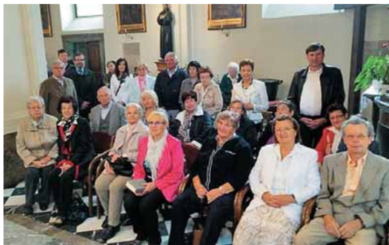
Tudi naša slovenska skupnost je spremljala sv. mašo s petjem.