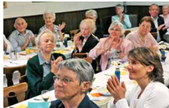
Poslušalci so v dvorani slovenske misije v Eisdnu z aplavzom nagradili Združeni zbor Slomšek.