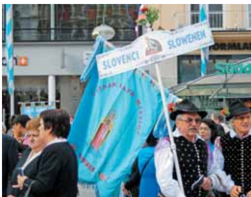
Ob verskih slovesnostih se narodne skupine vpletajo v praznično slavlje krajevne Cerkve

Njeno poslanstvo je izjemnega pomena za slovenstvo, narodno zavest in vero naših ljudi po Evropi. Domoljubje v zvestobi Bogu in narodu je bilo njeno načelo in gonilna moč. Njeno vlogo pri ohranjanju jezika in narodnih vrednot naj ocenijo drugi. Njenim ustvarjalcem pa osebno priznavam izjemno veliko požrtvovalnost, naročnikom pa pričevanjsko držo v razmerah, ko je bil vsak naročnik že