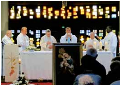
Oltarna miza je v Habsterdicku združila francoske in slovenske sobrate k isti daritvi.