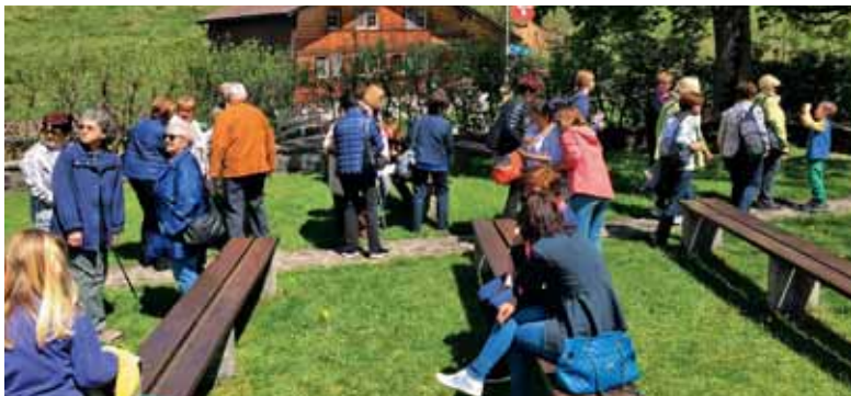
Švicarski Slovenci na romanju v Ahornu