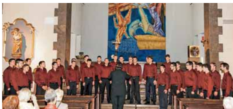
Zbor Vinko Vodopivec v Mannheimu

Primorski akademski pevski zbor Vinko Vodopivec, ki ga sestavljajo v glavnem primorski študentje, ki študirajo v Ljubljani, ima že dolgo tradicijo preko šestdeset let.