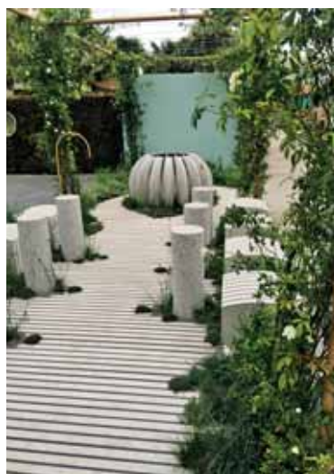
Pepin kraški vodnjak, Chelsea Flower Show