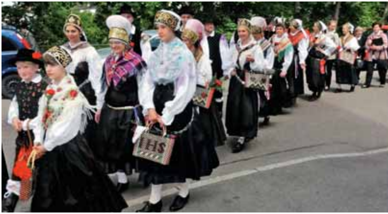
Slovenske narodne noše v procesiji