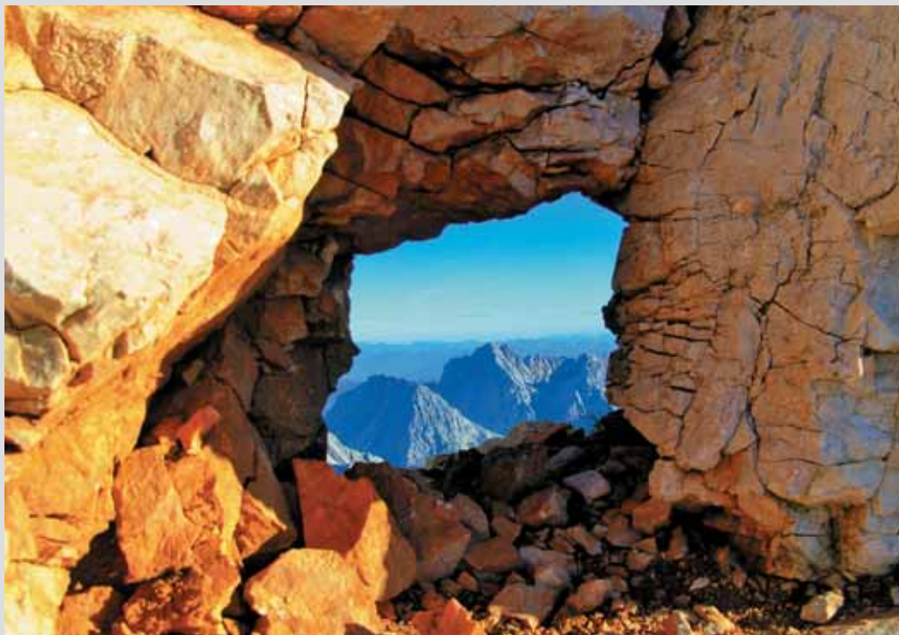
Pogled skozi triglavsko okence

Se srečata soseda. »Včeraj je tvoj pes ugriznil mojo taščo.«