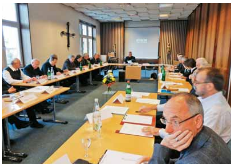
Konferenca škofijskih referentov in zastopnikov narodnih župnij leta 2012 ...