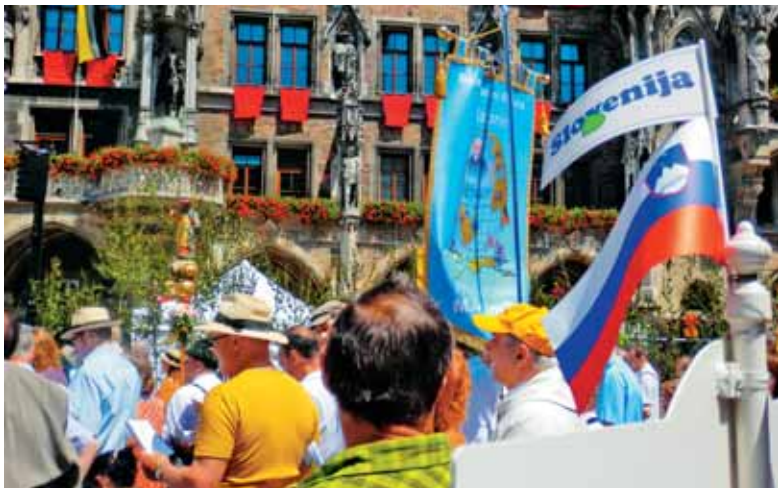
Na Marijinem trgu se je zbralo na telovo 4000 ljudi ...