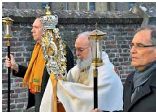
Velikonočna procesija v Heerlenu 2012, Nizozemska

Osnove sem imel dobre, kar zadeva slovnico. Govornega jezika pa nisem obvladal in sem se potil pri postavljanju stavkov. Bilo je kar nekaj zabave za vernike. Nemci so potrpežljivo prenašali moje vaje. Ko sem v prvih tednih sredi Essna vprašal nekoga, kje je železniška postaja, se je skoraj pridušal, da tega v Essnu zagotovo ni.