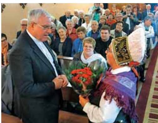
Prvič je novi škof Jean-Christophe Lagleize prestopil prag slovenske misije.