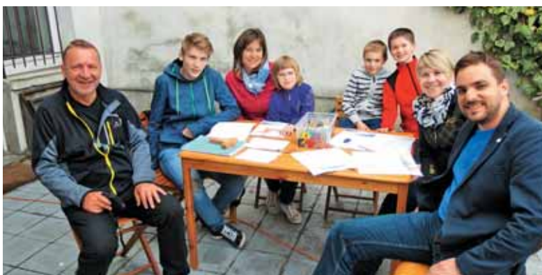
Priprava na prvo sveto obhajilo in birmo je lahko tudi prijetna in ustvarjalna.