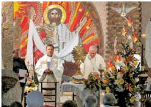
Obhajilo – trenutek, ko vsak izmed nas postane živi tabernakelj v novi zavezi.