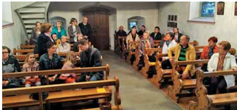
Skupnost v Hunenbergu je zvesta in vztrajna.