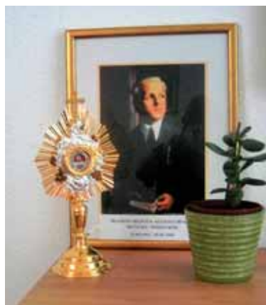
Relikvije bl. Alojzija Grozdeta

Na zadnjo majniško nedeljo smo lahko ob prazniku mučenca bl. Alojzija Grozdeta po nedeljski maši po-