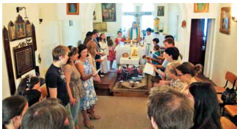
V krogu okrog oltarja pri nedeljski maši v kapeli SPC

sveto mašo. Marijin mesec maj je še bolj povezal člane naše mlade skupnosti v Bruslju, dal nam je novega zagona in poleta. Hvala Mariji, ki nas