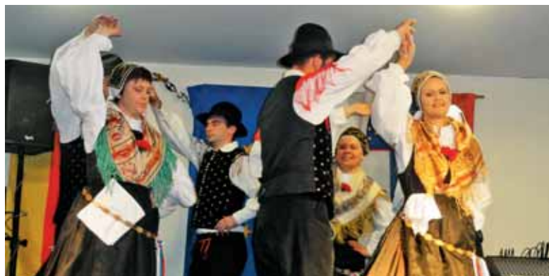
Nastop folklorne skupine Triglav-Stuttgart