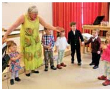
Vrtec se je zavrtel in pel.

Marijin mesec je minil v šmarničnem vzdušju. V kapeli župnijskega doma smo vsak večer ob 19 h obhajali sveto mašo in pred Najsvetejšim zmolili litanije Matere božje. Imamo nekaj rednih molivk in molivcev, drugi se udeležijo šmarnic občasno, kadar pač morejo priti. Tako se je kakšen večer zbrala kar številna skupina in častila Marijo. Nekaj večerov smo izbrali kakšen poseben molitveni namen, sicer pa je bilo prepuščeno udeležencem,