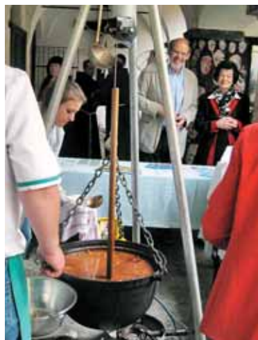
Kotel z bogračem je bil hitro prazen.