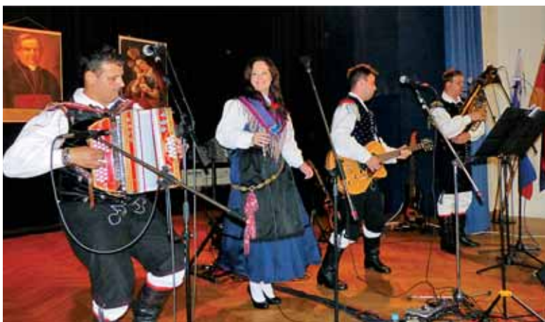
Ansambel bratov Žerjav v Essnu na binškošnem srečanju 2015