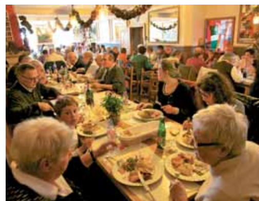
Dvorano in zimski vrt smo napolnili ob skupnem romarskem kosilu v Merlebachu.