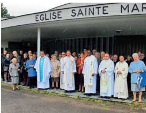
Dež nam je preprečil skupni posnetek pred cerkvijo, ne pa notranje sreče.