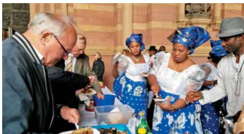
Letos so nas pri romanju v Speyerju pogostili Afričani.