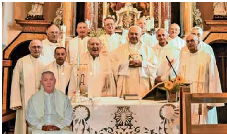
Zlati maturanti Vipava 1965–2015