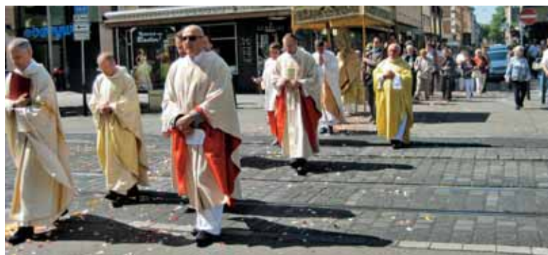
Procesija sv. Rešnjega telesa po mestnih ulicah