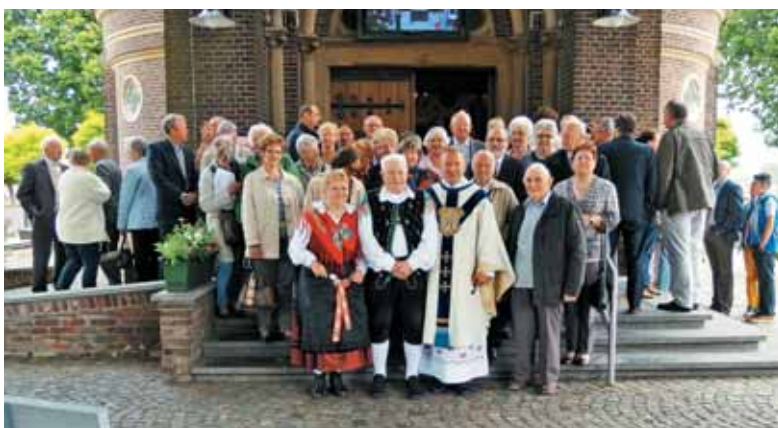
Skupina udeležencev binškošnega romanja v Heppeneertu