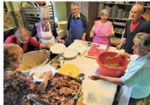
Pridne kuharice so imele kar veliko dela ob pripravi opoldanskega romarskega kosila.