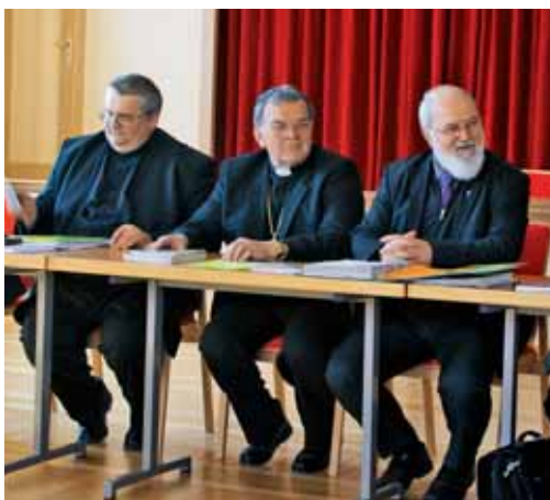
V vlogi predsednika zveze izseljenskih duhovnikov

Uvodnik v prvo številko januarja 1952 nagovarja Slovence in pojasnjuje: »Da bi vam vsem povedali toplo besedo, besedo tolažbe, besedo v nasvet, da bi vas sredi trdega življenja razveselili, vam na začetku novega leta prižigamo »Luč«. Naj vam sveti ta luč, da bo vaš korak trden, da boste šli varno in pogumno naprej. Naj postane vaša – Naša luč.« Danes se zdi to poslanstvo veliko težje kot takrat.