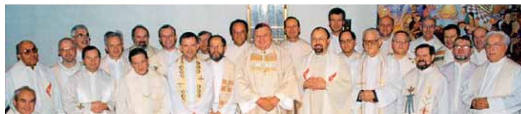
S slovenskimi sodelavci duhovniki na evropski božji njivi pred 15 leti

Začelo pa se je precej časa, preden smo uspeli obnoviti delovanje Rafaelove družbe. Izseljenski duhovniki, ki se niso mogli vračati v domovino zaradi komunističnega režima, so si Sv. Višarje izbrali za pogled v domovino in za razgled v vse druge smeri sveta. Mati božja združuje, v svojem naročju potolaži in zagotavlja mogočno priprošnjo. Višarska Marija ve, kako nam gre Slovincem, ker smo ji zvesti