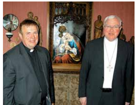
Slika Marije Pomagaj v sprejemnem salonu misije s škofom in župnikom