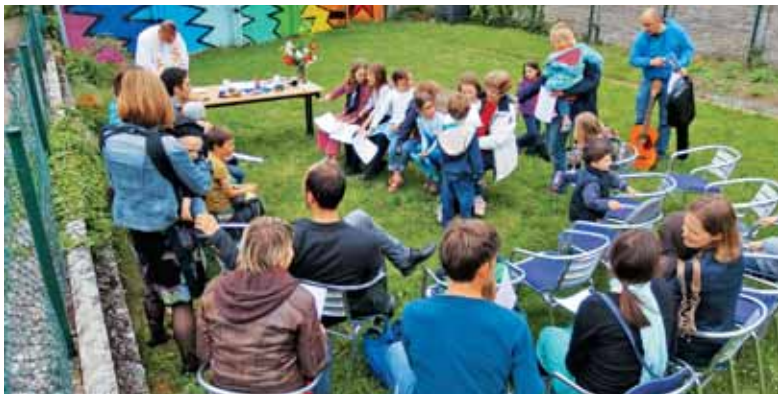
Priprava na šmarnično pobožnost in sveto mašo v Luksemburgu

kot dobra mati vodi k Jezusu in je zato tudi mati Cerkve.