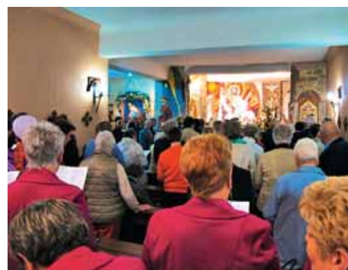
Pred Najsvetejšim smo ob Mariji rekli Bogu hvala za človeško in duhovno bogat dan.