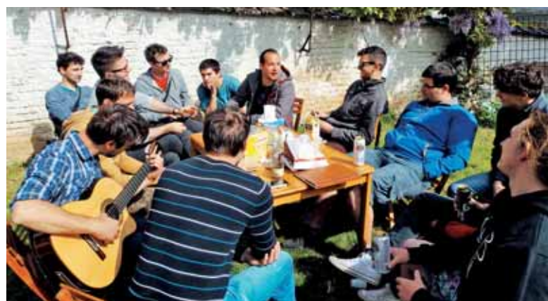
Pevci Primorskega akademskega zbora na vrtu SPC v Bruslju